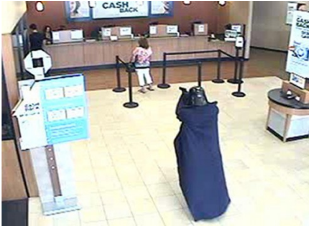
New York, luglio 2010