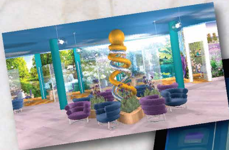
Sportello "Touch" della Banca Olistica.

Due anni di approfonditi test sul campo in quattro Banche (le due maggiori e due BCC) hanno evidenziato risultati eccellenti, comunicati all'evento ABI Costi e Business dell'ottobre 2011 da docenti di MIP Politecnico di Milano , Libera Università Bocconi e vertici delle Banche clienti.